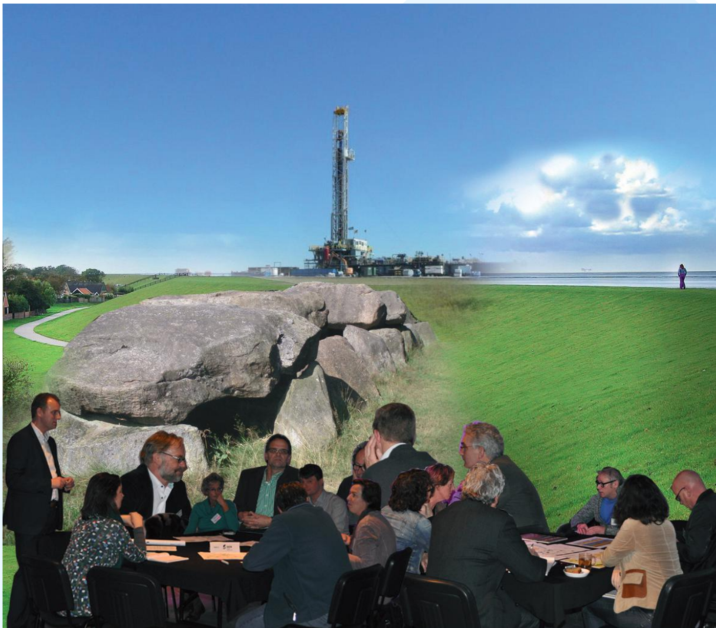
Impressie kick-off bijeenkomst januari 2015